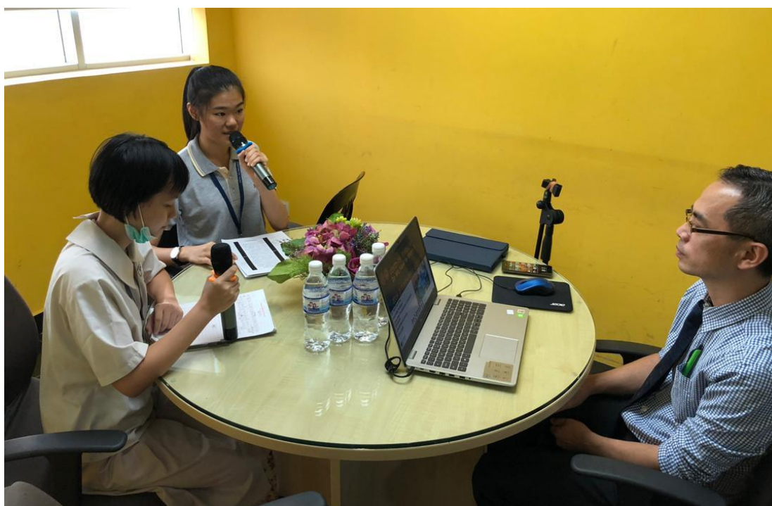
“全民防疫，刻不容缓”谈新冠状肺炎（Covid-19）讲座于训导处特设广播室进行。