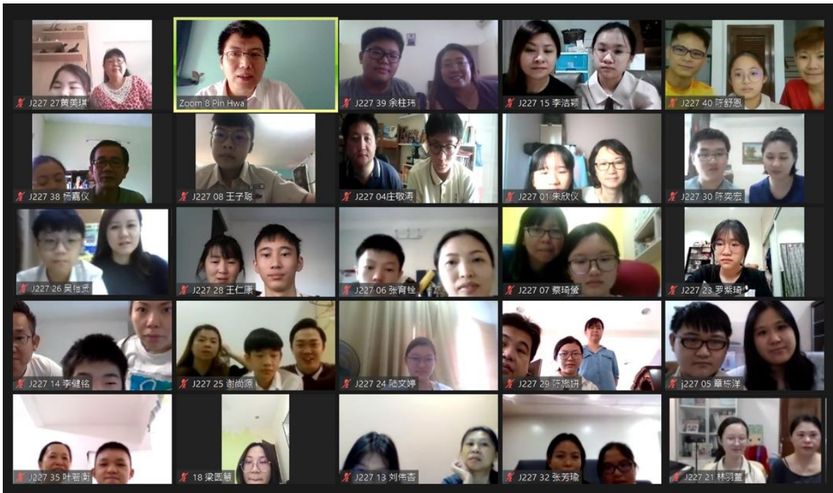
照片二：家长日促进亲师间交流，令家长留下深刻印象，高度肯定滨中学生的领导力。